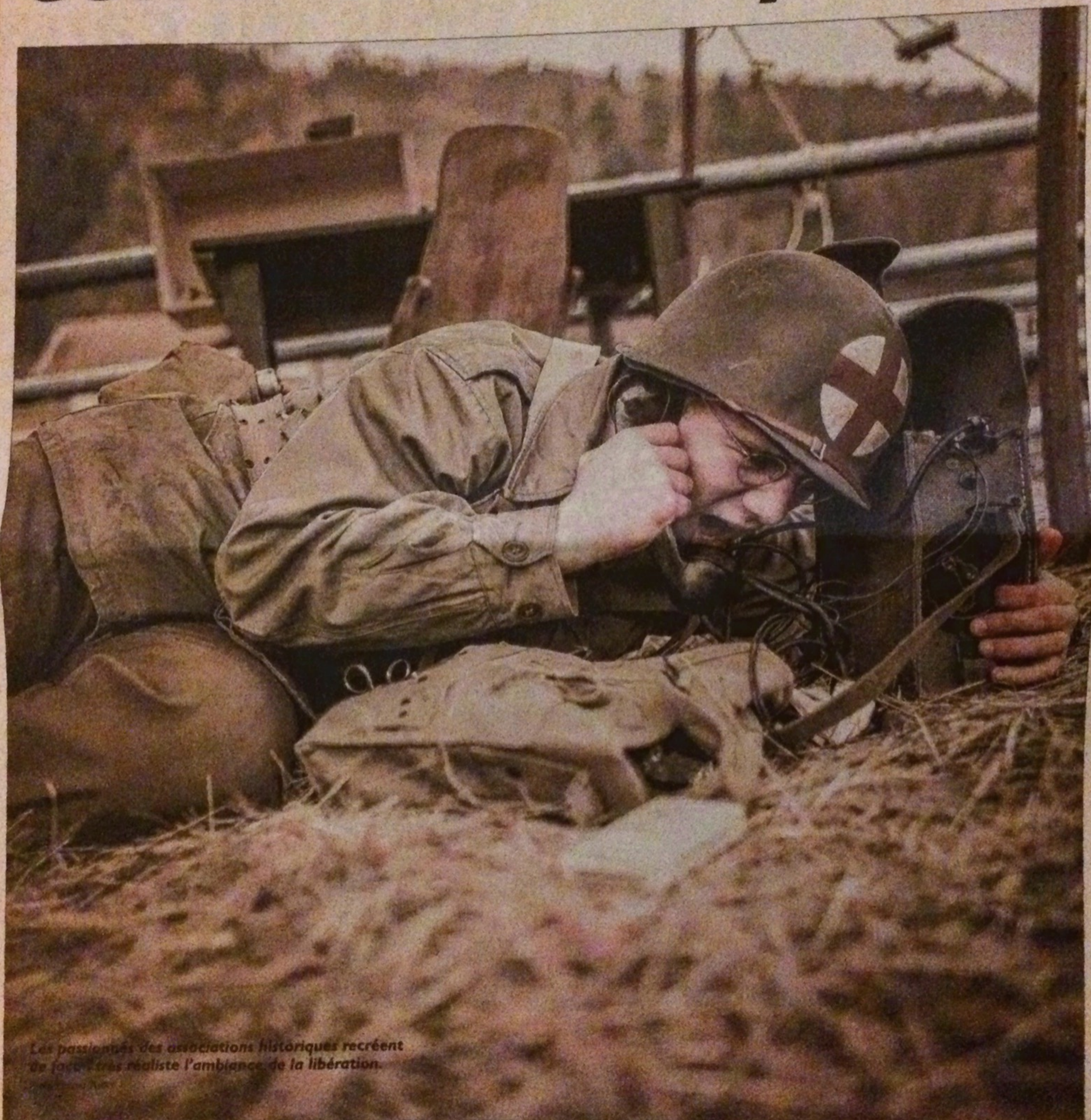
Les passionnés des associations historiques recréent de façon très réaliste l'ambiance de la libération.

Lutzembourg a fait un bond de soixante-dix ans en arrière ! Durant tout ce week-end, le village célèbre sa libération. Les animations et reconstitutions se multiplieront notamment aujourd'hui, et replongeront les spectateurs dans l'ambiance de 1944.