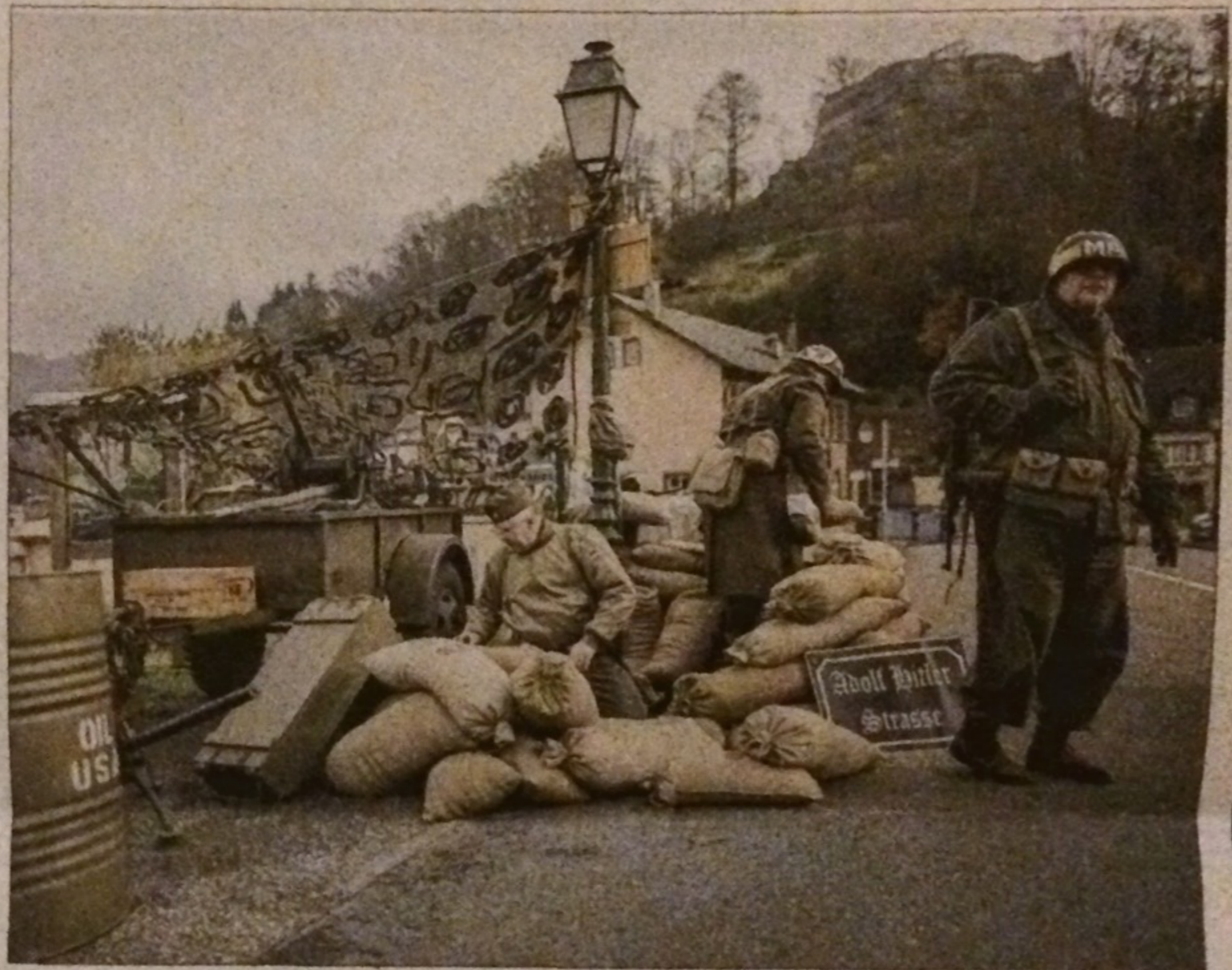
Les troupes américaines ont pris place hier sur le pont de la Zorn. Elles seront rejointes aujourd'hui par d'autres Gi's et 25 véhicules de l'époque.

Pour rester dans l'ambiance, une restauration rapide typiquement américaine sera mise en place, avec des hot-dogs, hamburgers, etc.